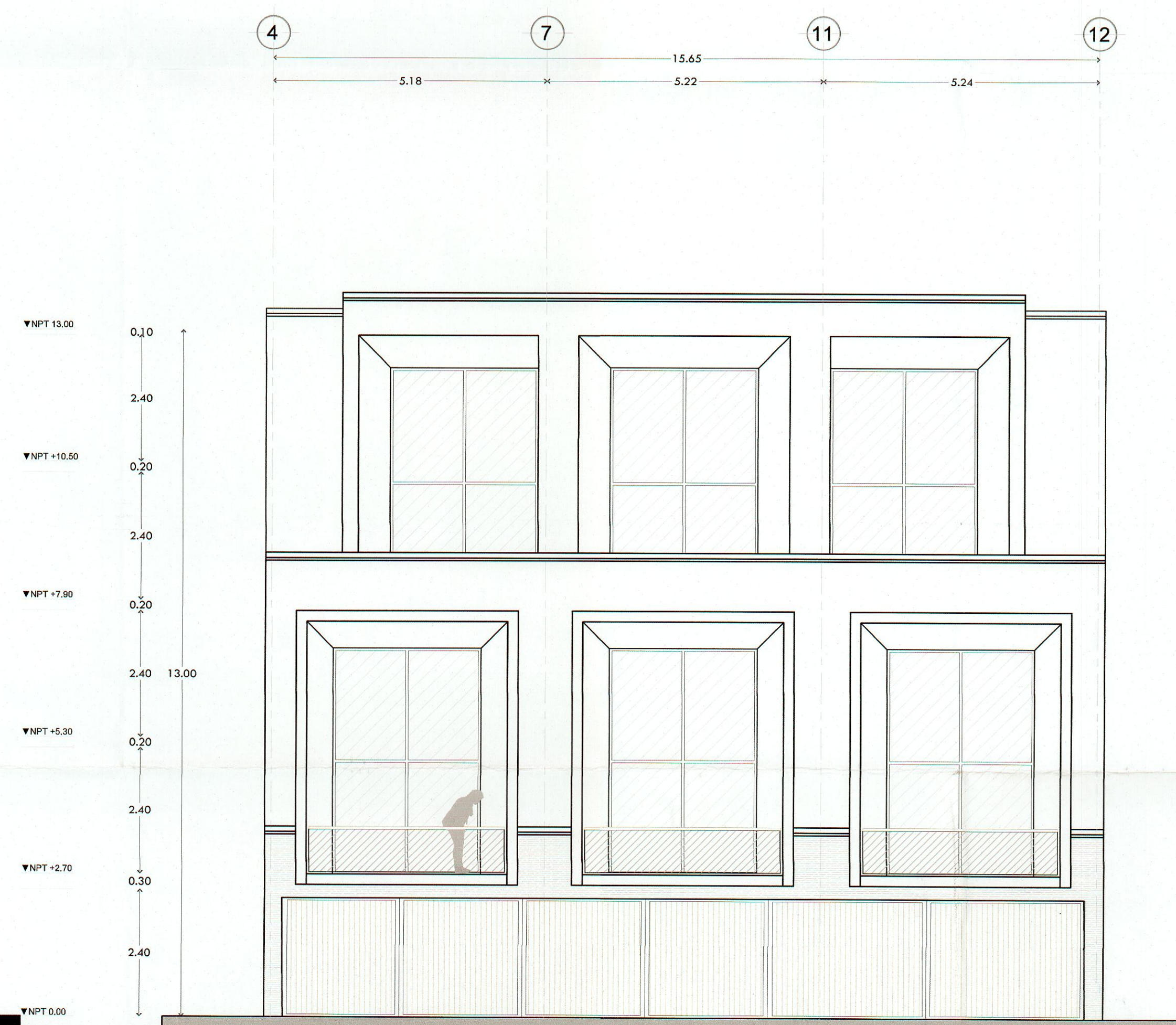
Fachada Principal Arquitectónico