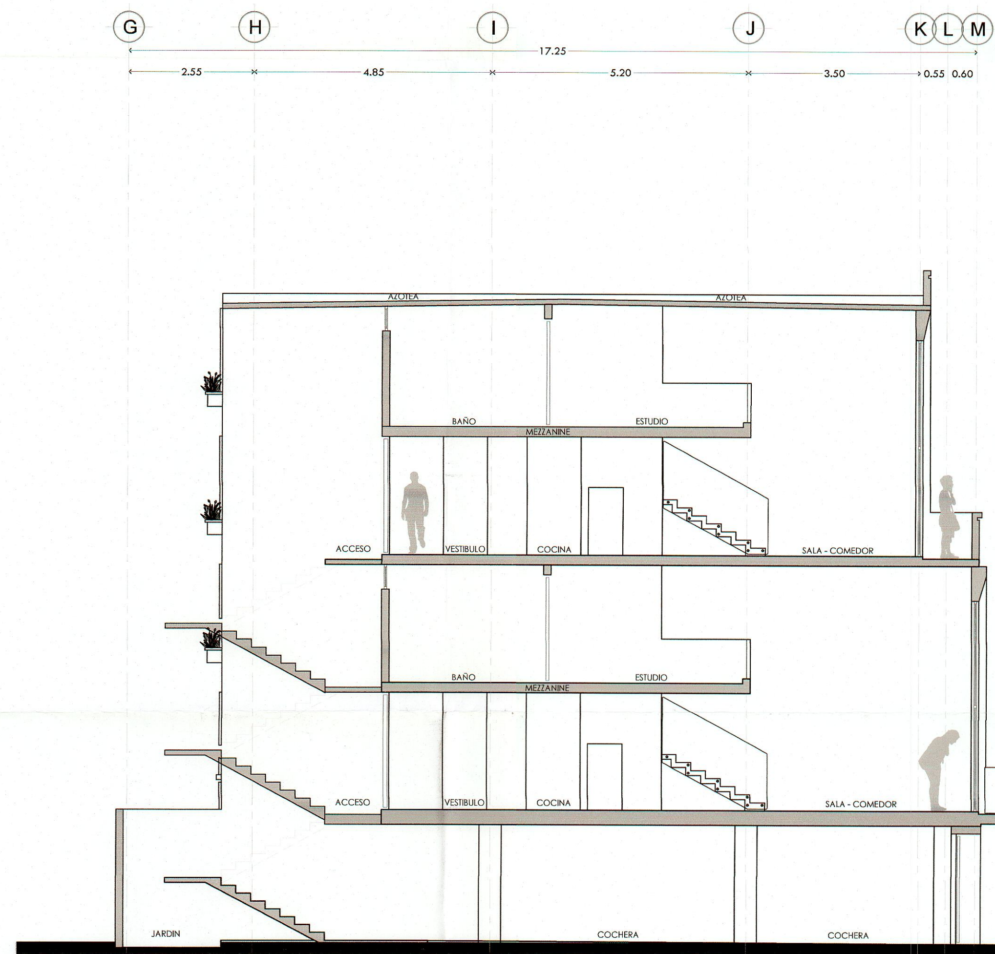
Corte A - A' Arquitectónico